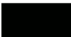
RAL 9004 Signal-schwarz CMYK 100 90 100 80