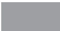
RAL 7004 Signalgrau CMYK 0 0 0 45