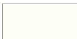
RAL 9010 Reinweiß CMYK 0 0 5 0