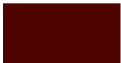
RAL 3009 Oxidrot CMYK 5 90 100 80