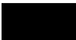
RAL 8022 Schwarzbraun CMYK 100 100 80 95