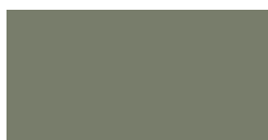
RAL 7003 Moosgrau CMYK 30 20 40 40