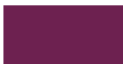
RAL 4004 Bordeauxviolett CMYK 60 100 50 20