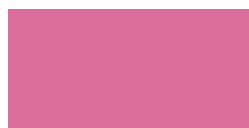
RAL 4003 Erikaviolett CMYK 10 70 10 0