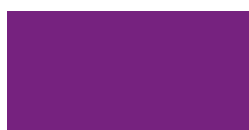
RAL 4005 Blaulila CMYK 60 100 5 10