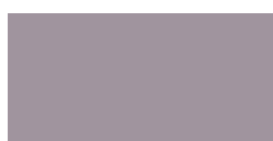
RAL 4009 Pastellviolett CMYK 40 40 30 0