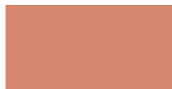
RAL 3012 Beigerot CMYK 5 50 50 10