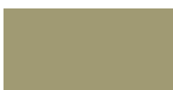
RAL 7034 Gelbgrü CMYK 5 5 40 40