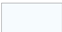
RAL 9016 Verkehrsweiß CMYK 3 0 0 0