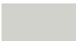
RAL 7047 Telegrau 4 CMYK 0 0 5 20