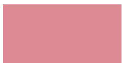
RAL 3015 Hellrosa CMYK 0 50 20 10