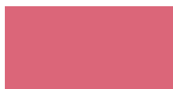
RAL 3014 Altrosa CMYK 0 70 30 10