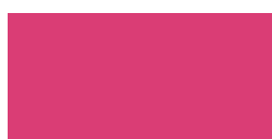
RAL 4010 Telemagenta CMYK 10 90 30 0