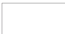
RAL 9003 Signalweiß CMYK 0 0 0 0