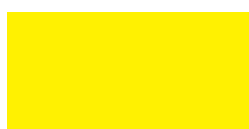
RAL 1026 Leuchtgelb CMYK 0 0 100 0