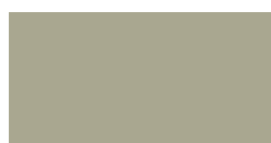
RAL 7032 Kieselgrü CMYK 0 0 20 40