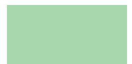
RAL 6019 Weißgrün CMYK 35 0 40 0